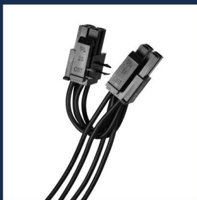
CPU4+4P x 1