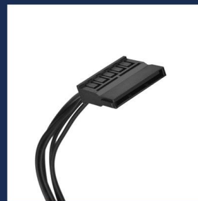
SATA x 3