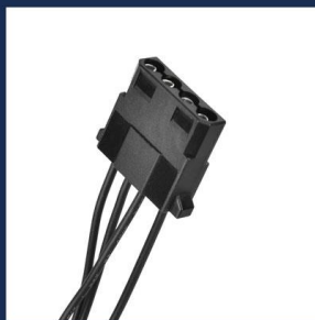
Peripheral 4P x 1