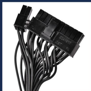
MB20/24P x 1