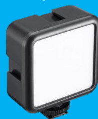
LED-лампа для підсвічування