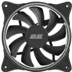
2E GAMING (2E-F120OR-ARGB )