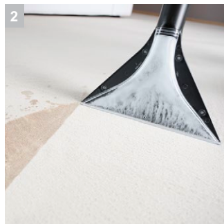
2 Конструкція насадки прискорює висихання на 50%