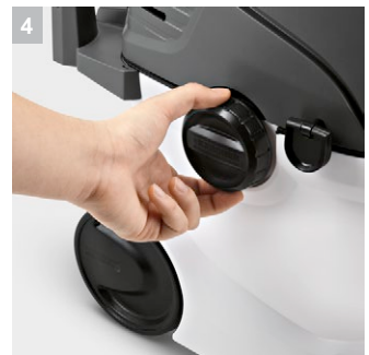
4 Привабливий дизайн з великими кнопками на корпусі