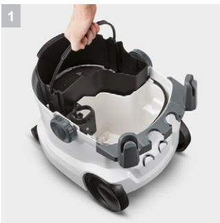
1 Система з двох баків

Миючий пилосос Kärcher SE 6.100 забезпечує зручне і якісне виконання найрізноманітніших робіт - від освіження м'яких меблів до очищення сильно забруднених килимів. А знявши бак для чистої води, цей апарат можна використовувати і в якості повноцінного господарського пилососа.