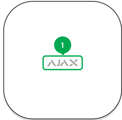
1 - Логотип зі світловим індикатором.