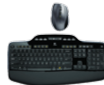
Клавиатуры и комплекты