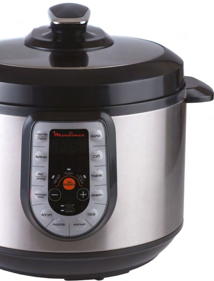
МУЛЬТИВАРКА MOULINEX CE500E32