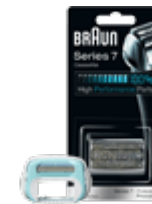
Аксессуары к бритвам и эпиляторам