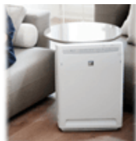
Воздухоочистители (мойки воздуха)