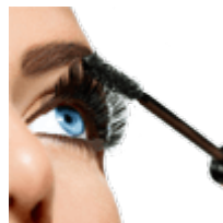
Тушь для ресниц