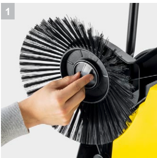
1 Практичний ковпачок для бічної щітки

Ідеально підходить для застосування протягом всього року на великих і широких площах і ретельного очищення по краях: підмітальна машина S 6 Twin з двома бічними щітками, 38-літровим контейнером для сміття і шириною підмітання 860 мм.