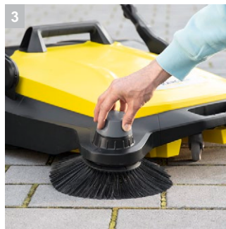
3 Гнучке регулювання висоти бічних щіток